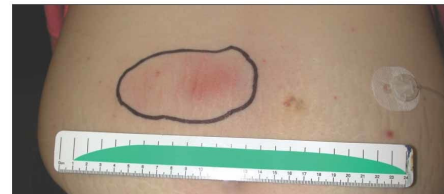
Follikulitis, Abszess nach Pumpenapplikation